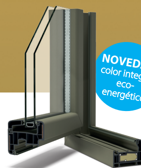
SECCIÓN EN PVC OMNIRAL Interior del perfil en color lacado

Excelente aislamiento (A+++) (Uf= 0,98W/m 2 K) Pintura con base acuosa 100% reciclable